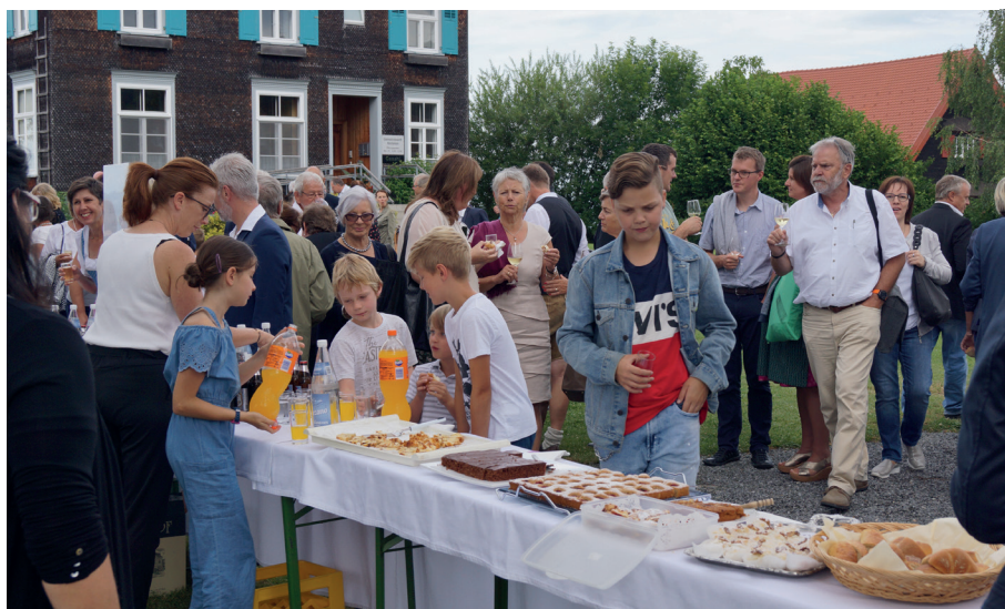
Das Agapenbuffet ein Augen- und Gaumenschmaus.