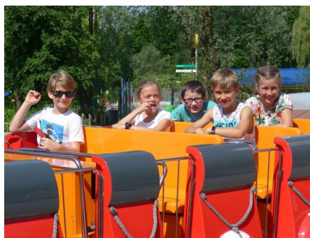
Ausflug der 4. Klässler ins Ravensburger Spieleland