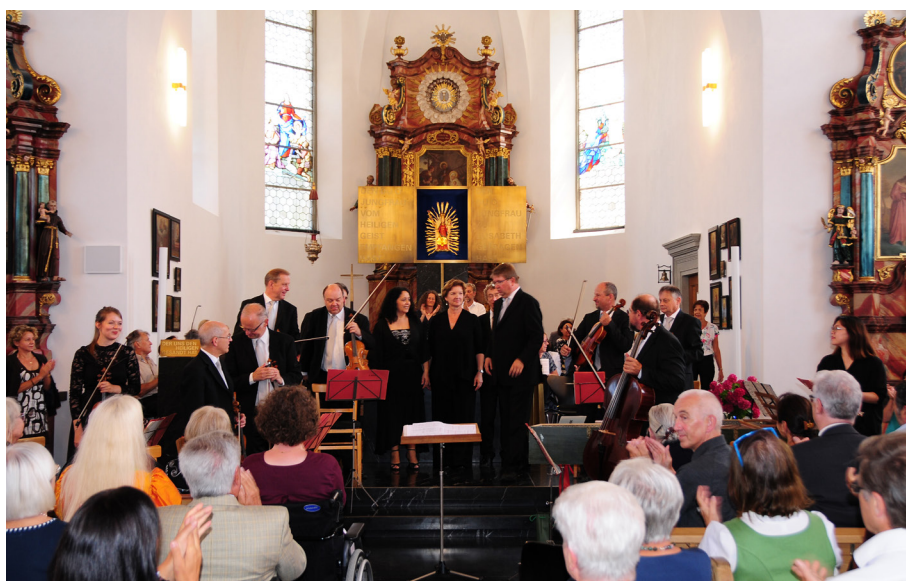
Barockensemble der Wiener Symphoniker.