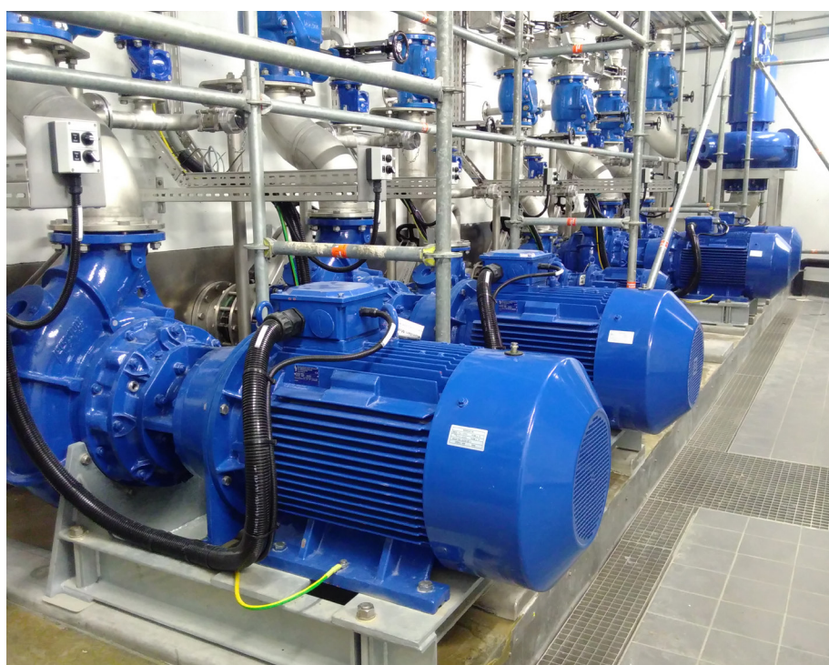
Mächtige Pumpen im neuen Abwasserpumpwerk des Wasserverbandes Hofsteig

Diese Tests dauern rund vier Wochen. Sie werden mit Trinkwasser aus dem Netz durchgeführt, um bei allfälligen Einstellungsarbeiten Probleme zu vermeiden. Voraussichtlich im Dezember 2019 geht das Pumpwerk in den Echtbetrieb.