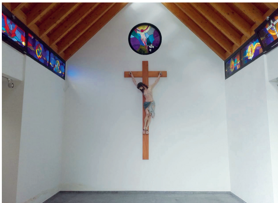
Der neue TrauerRaum in Bildstein befindet sich in der Friedhofskapelle neben dem Friedhof.